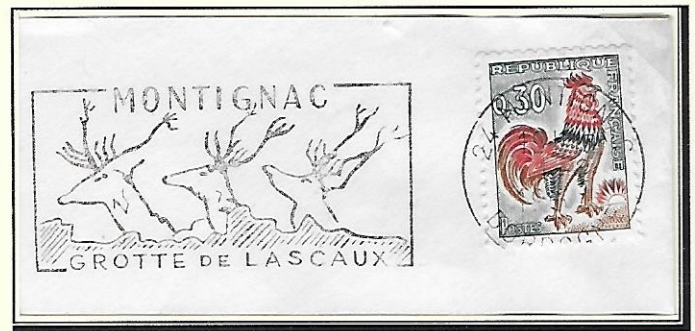
Lascaux (Dordogne) : "Cerfs élanes aux bois magnifiés" de la grotte, datation des peintures vers 17000 av.J.C.

Les artistes de la préhistoire disposaient d'une palette dominée par les rouges, ocres, jaunes, noirs et blancs. Ils utilisaient le charbon de bois comme fusains. La majorité des gravures pariétales représentent la faune locale. La représentation d'une figure humaine est assez exceptionnelle.