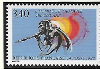
L'homme de Tautavel (Pyrénées-Orientales)

V ers 17 000 avant notre ère des hommes inventent l'art pariétal ; la décoration suit la structure de la caverne, elle s'adapte à la forme des parois, se joue des irrégularités.