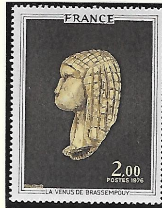
Brassempouy (Landes) : Dame ou Venus en ivoire, vers 23000 av.J.C. (haut. 3,5cm, long. 2,2cm, larg. 1,9cm.)