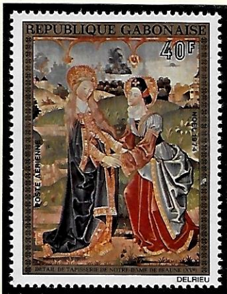
Beaune (Côtes-d'Or) : tapisseries dites "de la vie de la Vierge" commandées en 1474, offertes à l'église en 1500.

La tapisserie se détache vers la fin du XIVe, époque où cet art - longtemps tenu pour mineur - occupe une place de choix dans l'évolution des goûts. Au cours du siècle suivant, les tapisseries délaissent presque partout la scène ou le récit pour s'adonner au pur ornement ; leur décoration toujours très riche s'inspire de motifs floraux.