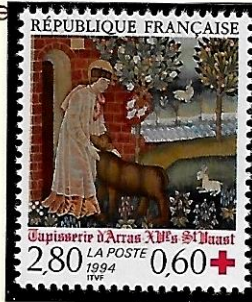
Arras (Pas-de-Calais) : musée -, grand centre de "lissiers", une tapisserie d'Arras, "saint- Vaast", seconde moitié du XVe.

↑ Timbre de feuille, couleurs plus ternes que celles du timbre en carnet. →