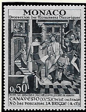
La Brigue (Alpes-Maritimes) : les fresques de 1492 couvrent l'ensemble des murs de la Chapelle.