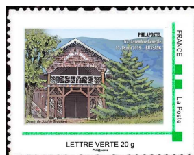
MTAM 3 de la planche de 20 TP

Exceptionnellement, afin de satisfaire le maximum d'entre vous, nous vous proposons d'acquérir à l'unité ce MTAM3 constituant une planche prédécoupée.