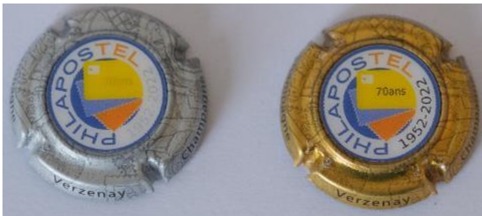
Capsules tirées à 180 exemplaires numérotées

Comme annoncé dans le catalogue n°13, Philapostel a réalisé deux capsules holographiques (animées) pour célébrer ses 70 ans.