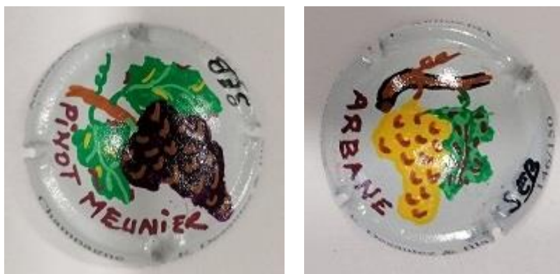
Capsules tirées à 150 exemplaires numérotées

De plus, pour continuer à innover l'illustrateur Sébastien BORDENAVE (adhérent de notre association), plus connu sous le nom de SEB, a accepté de réaliser deux capsules sur les cépages. Chaque capsule est peinte à la main (PALM).