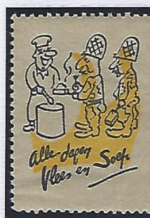
Le repos du guerrier