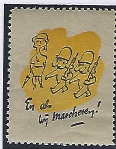
Participation aux parades, défilés militaires des 21 juillet et 11 novembre, Te deum, ainsi qu'aux gardes au Palais royal