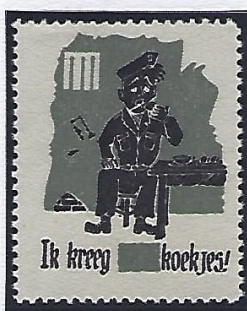
Les biscuits militaires et les repas mijotés