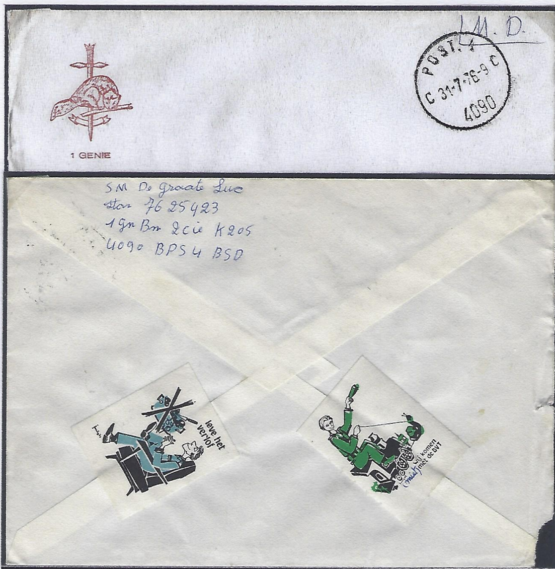
Lettre de 1976 – Pas de corvées pendant la permission et retour par le Train de permissionnaires journalier

Les permissionnaires stationnés en Allemagne empruntaient le fameux Train de permissionnaires journalier (TPJ). Cette vénérable ligne ferroviaire était à l'époque mieux connue que la plus célèbre des lignes internationales.