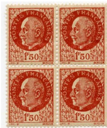
Bloc de quatre du 1f50 Pétain de Bersier