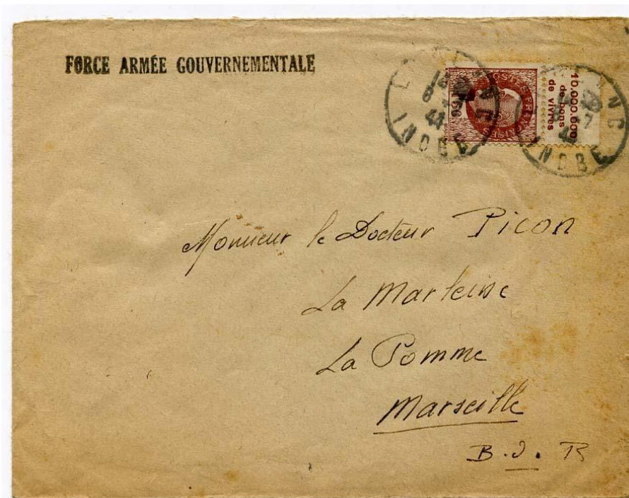
Lettre à entête « Force Armée Gouvernementale » de Le Blanc (Indre) du 8 juillet 1944 pour Marseille, affranchie d'un timbre de carnet avec marge publicitaire pour le Secours National « 10 000 000 de bons de vivres ».