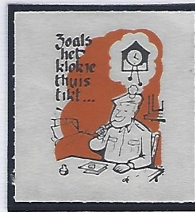
Chaque tic-tac rapproche.