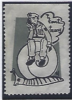
Le temps semble long.

Ces moments de pause, sans corvées ni autres contraintes de la vie de soldat, permettaient de se ressourcer à la maison.