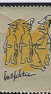
Les nombreuses inspections