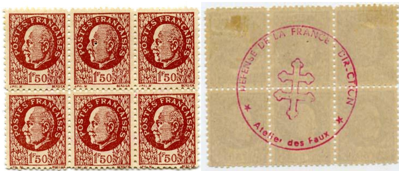
Bloc de six des Faux de la Résistance recto et verso avec cachet de l'Atelier des Faux.

En 1943, des résistants du réseau « Combat » de Nice impriment de manière artisanale de faux Pétain où l'effigie du Maréchal est remplacée par celle du Général De Gaulle (dits « Faux de Nice »).