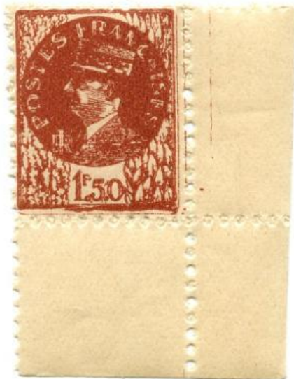
« Faux de Nice » coin de feuillet à l'effigie du Général De Gaulle.

De juillet 1944 à octobre 1945, le 1f50 comme les autres timbres à l'effigie du Maréchal Pétain ont été surchargés lors de la Libération.