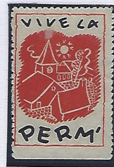
La maison enfin !!

Les permissionnaires stationnés en Allemagne empruntaient le fameux Train de permissionnaires journalier (TPJ). Cette vénérable ligne ferroviaire était à l'époque mieux connue que la plus célèbre des lignes internationales.