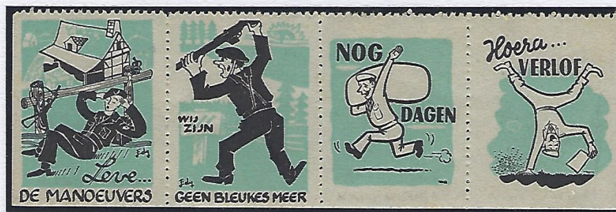
L'ancien est passé par toutes les étapes et a tout affronté. Au bout du parcours se profile le congé définitif.

Le bleu (nouvellement incorporé et à l'instruction), l'ancien (en unité), le super ancien (à la veille de la démobilisation). Les anciens ne manquaient pas de rappeler aux bleus ce statut sans privilège devant inspirer un respect profond. Les engagés volontaires étaient communément appelés « gamelle » !