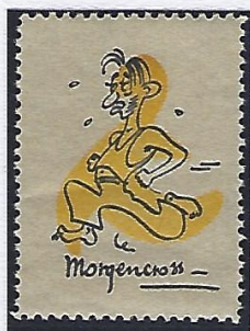
Obtention du Brevet élémentaire d'aptitude physique (Belap)